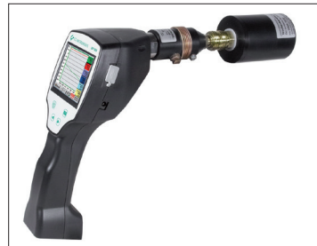
Trockenbehälter sorgt für Sensorschutz und eine schnelle Angleichzeit