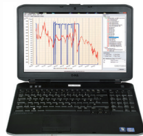
Übertragung der Daten per USB-Stick zum PC