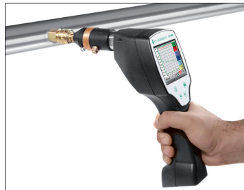
Schneller Einbau mit Messkammer und Schnellkupplung