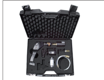
Ideal für den Servicetechniker – alles in einem Koffer