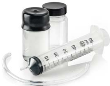
Zur Messung der Ölkonzentration am OSS-Ausgang ist ein optionales Probenkit verfügbar.

Das von geschmierten Kompressoren erzeugte Kondensat enthält Spuren von Öl und muss entsprechend aufbereitet werden, da Öl Umweltrisiken birgt. Kondensatlösungen von Atlas Copco ermöglichen es, Öl aus dem Kompressor-kondensat abzuscheiden und sicher zu entsorgen, bevor es ins Abwassersystem gelangt.