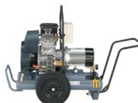
Trolley fahrbare Ausführung