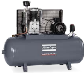
AC 40-11 E 270