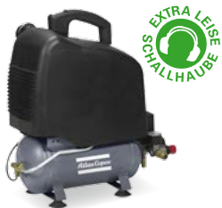
AH 10-8 E 6 M