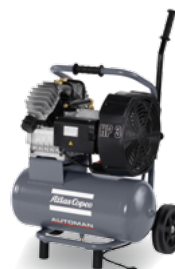
AF 30-10 E 24 M