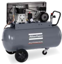
AC 31-10 E 50 M