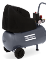
AH 15-8 E 24 M