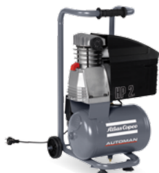
AF 25-10 E 10 M