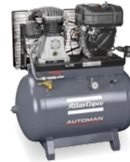
AC 71-14 T 270 Petrol