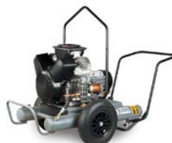
Trolley fahrbare Ausführung