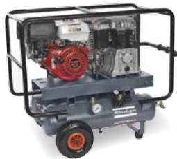
AC 56 + 71 E R Petrol