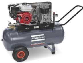
AC 56 E 50 + 100 + 200 Petrol