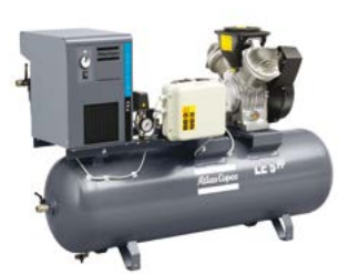
Sonderausführung: Komplette Druckluftstation mit FX-Kältetrockner sowie DD- und PD-Filtern, auf Behälter