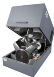
Pack Version Grundrahmen mit Schallhaube