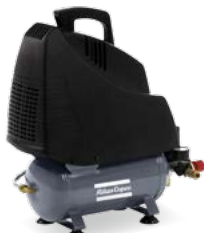
AH 15-8 E 6 M