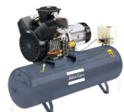
montiert auf Behälter