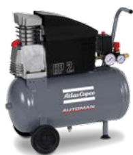
AF 20-10 E 24 M