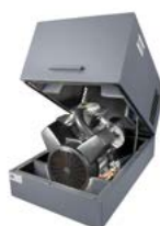
Pack Version Grundrahmen mit Schallhaube