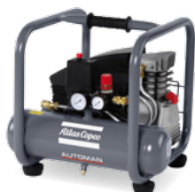
AF 25-10 E 6 M