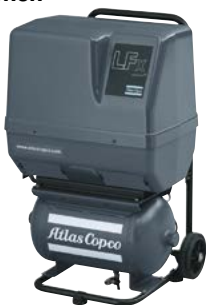
LFx Trolley 20-l-Behälter