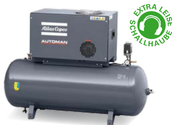
AC 55-11 E 270 T S