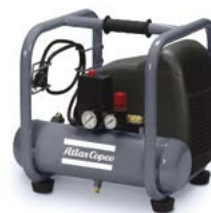
AH 20-8 E 6 M