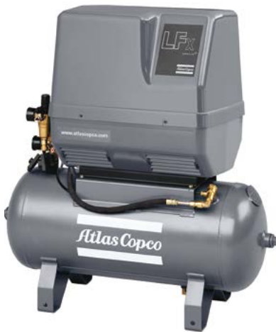
LFx montiert auf 50-l-Behälter

ölfrei verdichtende Kolbenkompressoren 10 bar | 0,55–1,5 kW