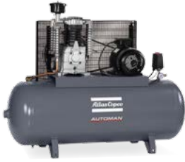
AC 40-15 T 300 T