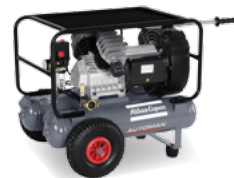
AF 30-10 E 2x11 M